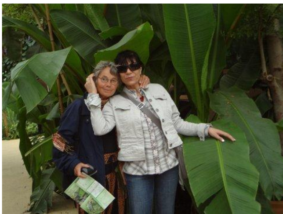
Bestuursuitje naar de Floriade in juni 2012