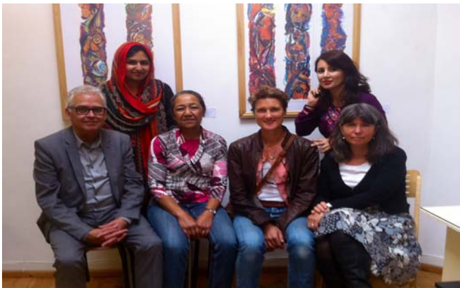
Stichting Ariana en de vrijwilligers van Humanitas Samenspraak Maastricht

Op 14 Juni heeft Humanitas voor haar vrijwilligers een dagje-uit georganiseerd. Daar hoort natuurlijk ook eten bij. Stichting Ariana verzorgde op deze dag het eten en heeft een heerlijke buffet gekookt bestaande uit allerlei Afghaanse hapjes voor de lunch.