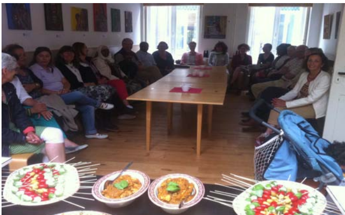
De vrijwilligers luisteren geboeid naar de presentatie over Stichting Ariana

voorgerecht bestond uit caprese spiesjes en bladerdeeghapjes gevuld met gehakt (samosa) en een daarbij behorende frisse munt- en yoghurtsaus. Voor het hoofdgerecht hebben we ervoor gekozen om rijst met verschillende groenten en specerijen. Daarbij hebben we een pittige kip-curry geserveerd. Het nagerecht bestond uit Turks fruit en baklava met natuurlijk koffie of thee. Alles werd gemaakt met als hoofdingrediënt onze toewijding en enthousiasme voor stichting Ariana. Mmmm, smullen maar!