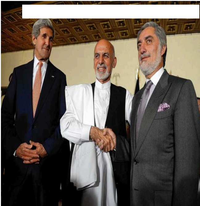
Abdullah Abdullah (rechts) en Ashraf Ghani met John Kerry (links)

Ashraf Ghani, 65 jaar en oud-minister van Financiën, mag zich officieel de nieuwe President van Afghanistan noemen. Na een tweede ronde van de presidentsverkiezingen in juni wist Ghani alsnog een meerderheid van de stemmen te behalen.